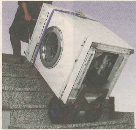
Schwere Lasten sind kein Problem.

Ländern verkauft werden. Nach diesem ersten Exportverkaufserfolg wurde kontinuierlich das internationale Händlernetz erweitert.