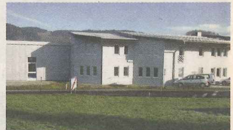
Die Firmenzentrale in Lichtenberg.

Mit 35 Mitarbeitern in der Unternehmenszentrale in Lichtenberg erwirtschaftet das Unternehmen einen Jahresumsatz von ca. 7,5 Mio. Euro. Für 2010 ist die Stimmung vorsichtig optimistisch, weil nach einem ruhigeren Jahr 2009 die Umsatz- und Auftragswerte für die letzten Monate bereits wieder kräftig gestiegen sind. Der Exportanteil des Unternehmens liegt bei über 90 Prozent. Für den eigenen Technikernachwuchs werden derzeit 7 Lehrlinge in Maschinenbautechnik ausgebildet.